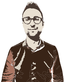
a cura di Riccardo Soliani Responsabile tecnico Regionale CAA Centro Assistenza Tecnica

Riapertura dei termini di presentazione delle domande dal 22 aprile al 19 giugno 2026