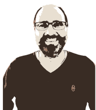
a cura di Christian Beber Responsabile Patronato Epaca

L'INPS, con la circolare 20/2026 fornisce finalmente le necessarie indicazioni operative per dare seguito alla sentenza della Corte Costituzionale 3 luglio 2025. Per effetto della sentenza della Corte Costituzionale n. 94/2025, la disciplina di cui all'integrazione al trattamento minimo trova applicazione anche per l'assegno ordinario di invalidità liquidato con il sistema contributivo .