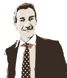
Enzo Bottos Direttore di Coldiretti Trentino Alto Adige

una pressione al ribasso sui prezzi, ma rappresenta un vero e proprio furto d'identità ai danni del lavoro onesto e della salute dei consumatori. Non possiamo più accettare che il succo di frutta ottenuto da concentrati extra-UE o che la pasta prodotta con grano straniero trattato con sostanze