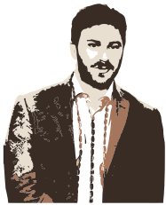
a cura di Paolo Forno Direttore di Redazione

E il Trentino è in prima linea con la Fondazione Mach