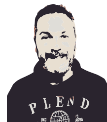
a cura di Giacomo Fascella Responsabile Ufficio Coldiretti Bolzano